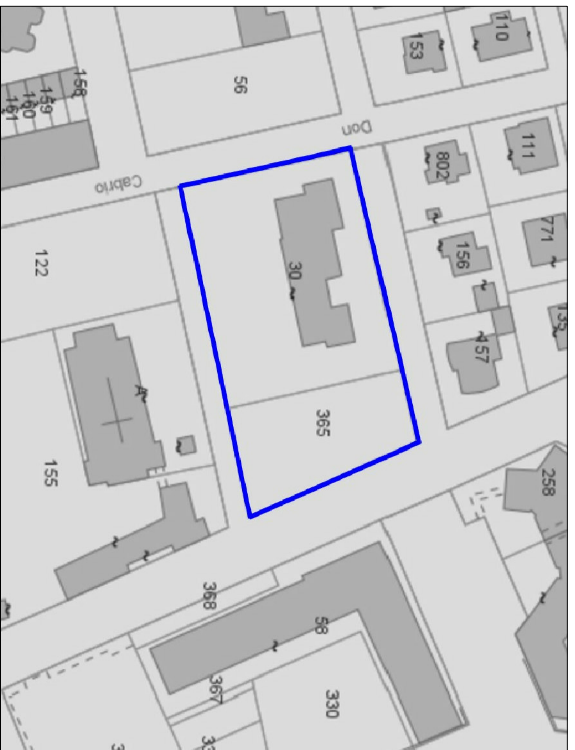
ESTRATTO MAPPA CATASTALE FG. 61 mapp.li 30 e 365